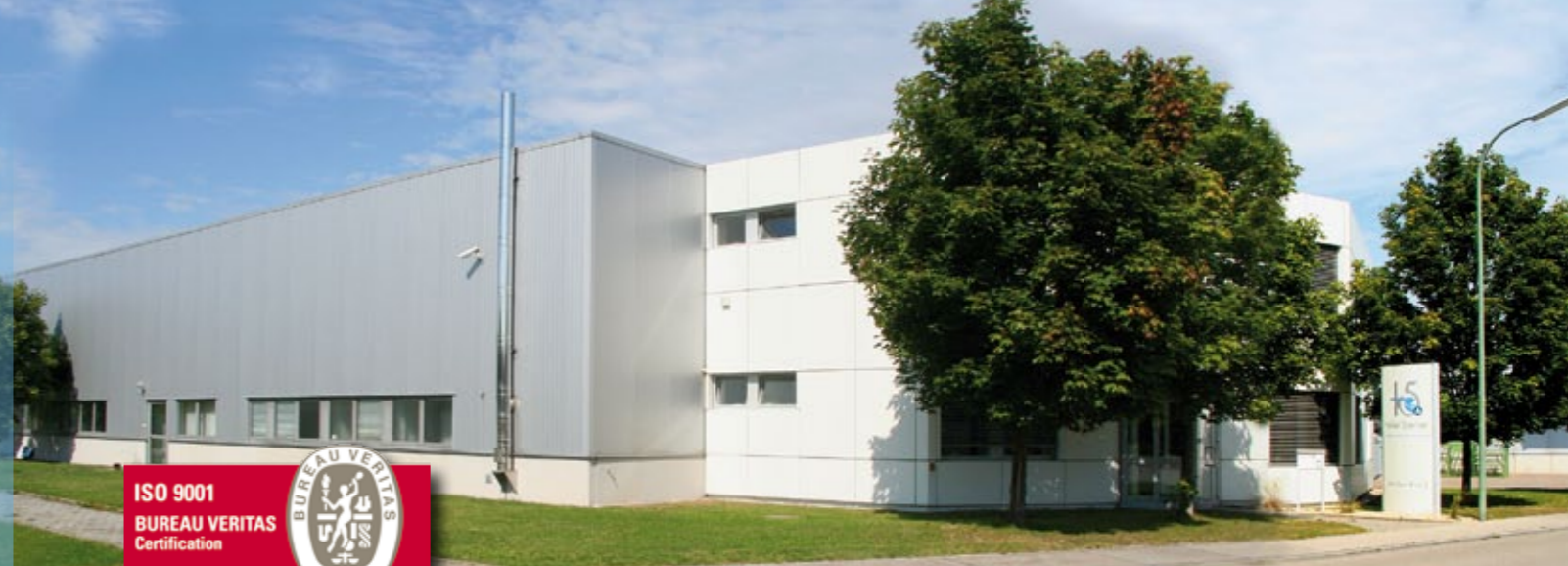
Das Kabel Sterner Firmengebäude, ca. 8.000 m 2 groß.