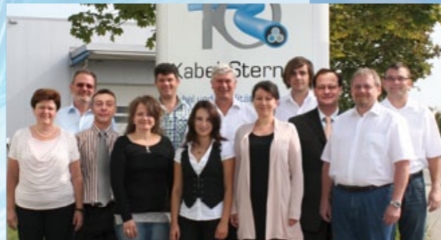
Das Kabel Sterner-Team